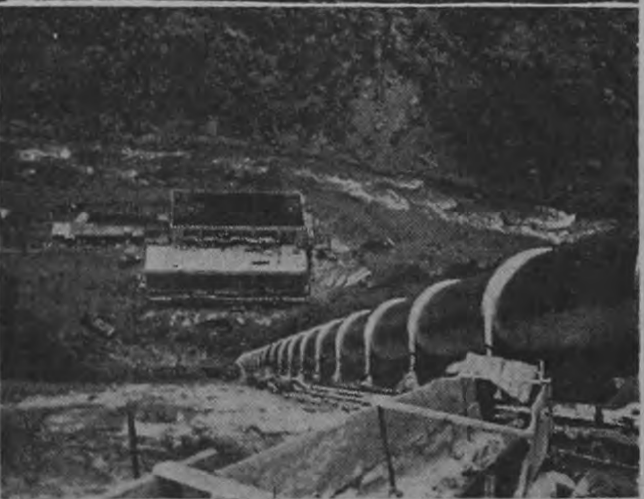
Las fotos muestran en primer término la presa de la planta "La Garita" tomada por primera vez llena y abajo la tubería de alta presión en cuyo control fue empleado el isótopo de CESIO 137 con toda eficiencia.